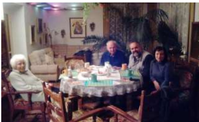
(Terciářské listy MBS Plzeň prosinec 2016)